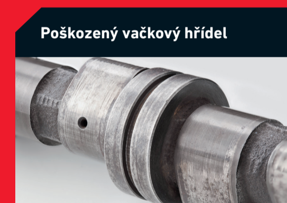
Poškozený vačkový hřídel

Možná příčina: • Nesprávná montáž filtru • Poškozené těsnění olejového filtru Řešení: • Kontrola správné montáže filtru • Dotažení nebo výměna filtru