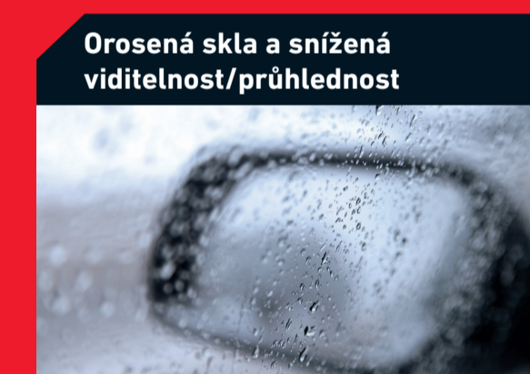
Orosená skla a snížená viditelnost/průhlednost

Možná příčina: Nečistoty v olejovém potrubí/kanálech Řešení: Propláchnutí olejových kanálů, výměna olejového filtru a vzduchového filtru