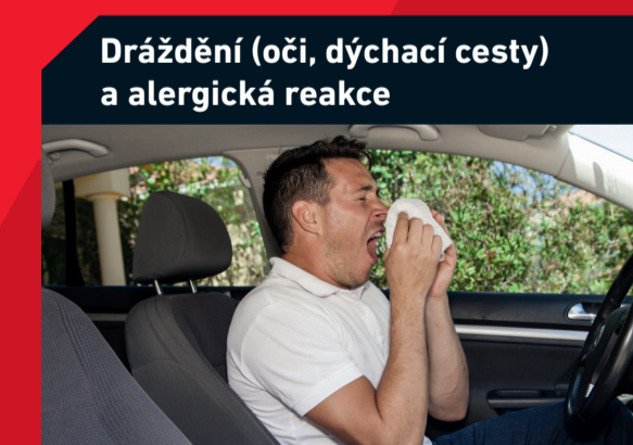
Dráždění (oči, dýchací cesty) a alergická reakce

Možná příčina: • Ucpání palivového filtru • Ucpání vzduchového filtru Řešení: • Výměna palivového filtru • Výměna vzduchového filtru • V případě potřeby propláchnout mazací kanály a vyměnit olejový filtr