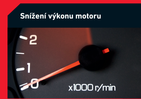
Snížení výkonu motoru

Možná příčina: Průchod nečistí přes sací nebo mazací systém motoru Řešení: Výměna olejového a vzduchového filtru a propláchnutí mazacích kanálů