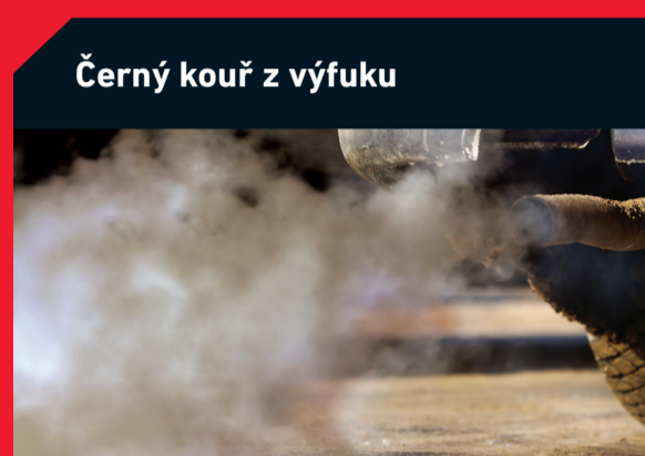
Černý kouř z výfuku

Možná příčina: Zanesený vzduchový filtr Řešení: Výměna filtru