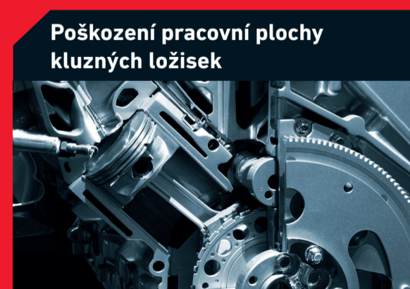
Poškození pracovní plochy kluzných ložisek

Možná příčina: Ucpaný palivový filtr Řešení: Výměna palivového filtru