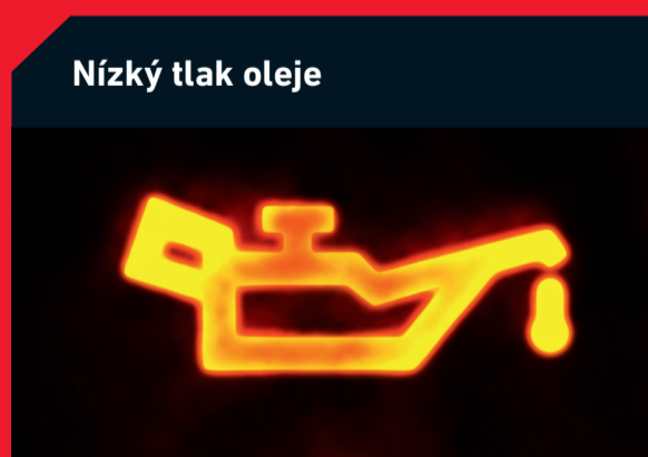
Nízký tlak oleje

Možná příčina: Znečištěný kabinový filtr snižuje výkon topení/klimatizace Řešení: Výměna kabinového filtru