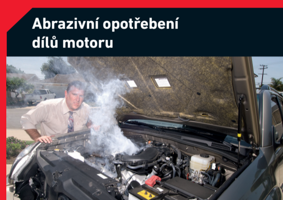
Abrazivní opotřebení dílů motoru

Možná příčina: Zanesený vzduchový filtr Řešení: Výměna filtru