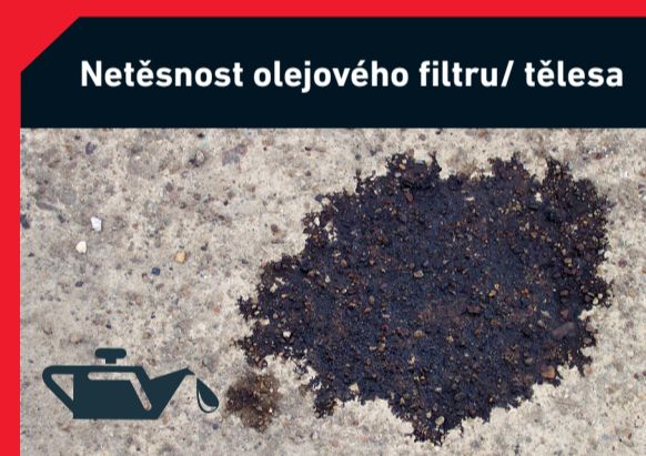
Netěsnost olejového filtru/ tělesa

Možná příčina: Nesprávná montáž filtru Řešení: Kontrola správné montáže filtru nebo jeho výměna