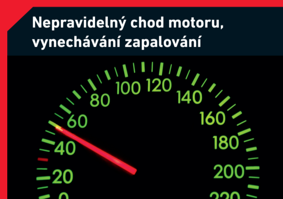
Nepřirozený chod motoru, vynechávání zapalování

Možná příčina: Ucpaný olejový filtr Solution: Propláchnutí olejových kanálů, výměna oleje a filtru