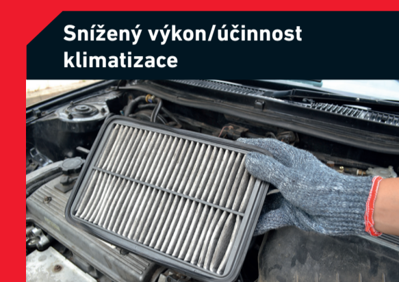
Snížený výkon/účinnost klimatizace

Možná příčina: Znečištěný vzduchový filtr Řešení: Výměna vzduchového filtru V případě potřeby propláchněte mazací kanály a vyměňte olejový filtr