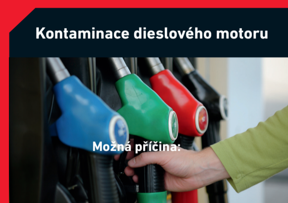
Kontaminace dieslového motoru

Možná příčina: Vniknutí nečistot poškozenou hadicí, ucpaný filtr nebo usazeniny v mazacím systému Řešení: Propláchněte motor od všech nečistot, vyměňte olej a olejový, vzduchový i palivový filtr