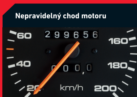
Nepřirozený chod motoru

Možná příčina: Kabinový filtr je ucpaný prachem a nečistotami a snižuje průchod vzduchu Řešení: Výměna kabinového filtru