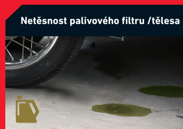
Netěsnost palivového filtru / tělesa

Možná příčina: • Ucpání vzduchového filtru • Voda v benzínu • Zanesený palivový filtr Řešení: • Výměna vzduchového filtru • Odčerpání paliva a výměna palivového filtru • Výměna palivového filtru