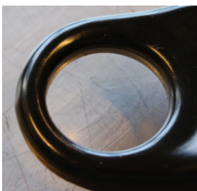
Primera sustitución de rótula

Es importante tener en cuenta que las rótulas no se pueden sustituir indefinidamente. Las operaciones repetitivas de desmontaje y/o apriete afectan significativamente tanto al diámetro como a la redondez del orificio del brazo, donde se presiona la rótula. Especialmente cuando el material del cuerpo del brazo es chapa de acero.