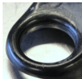
Tras sucesivas sustituciones de rótulas