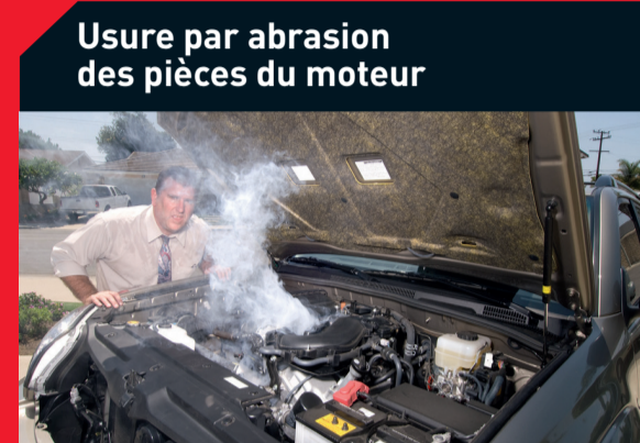
Usure par abrasion des pièces du moteur

Causes possibles : Filtre à air colmaté Solution : Remplacez le filtre à air