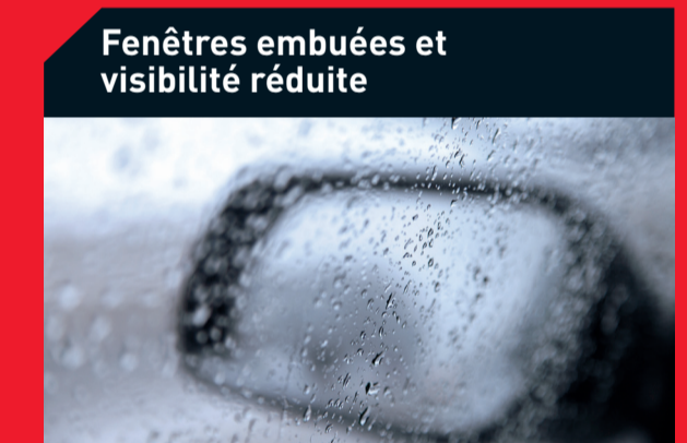
Fenêtres embuées et visibilité réduite

Causes possibles : Débris résiduels dans les canalisations d'huile Solution : Rincez les canalisations d'huile et remplacez les filtres à huile et à air