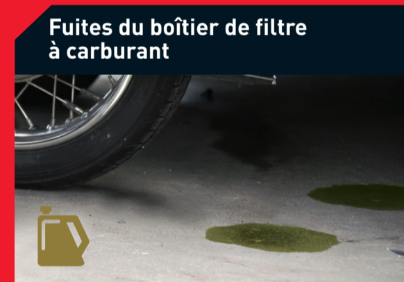
Fuites du boîtier de filtre à carburant

Causes possibles : • Filtre à air encrassé • Eau dans le carburant • Filtre à carburant obstrué Solution : • Remplacez le filtre à air • Videz le réservoir de carburant, remplacez le filtre à carburant • Remplacez le filtre à carburant