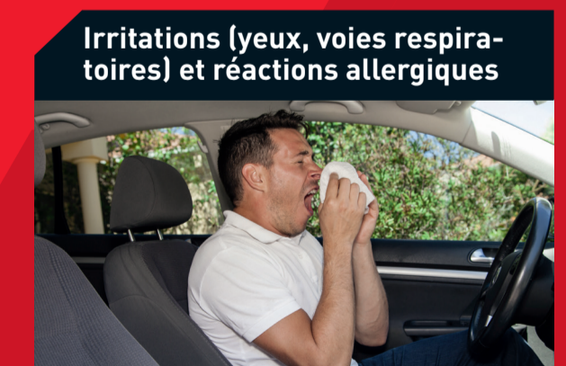
Irritations (yeux, voies respiratoires) et réactions allergiques

Causes possibles : • Filtre à carburant obstrué • Filtre à air encrassé Solution : • Remplacez le filtre à carburant • Remplacez le filtre à air • Remplacez le filtre à huile, rincez les canalisations d'huile