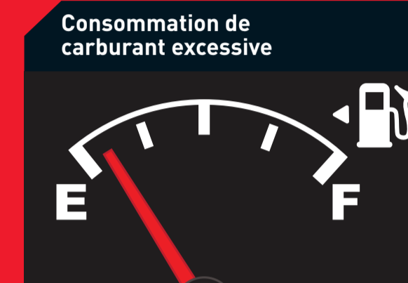
Consommation de carburant excessive

Causes possibles : Essence dans le gazole due à une erreur lors du plein Solution : Remplacez ou réparez les injecteurs, la pompe, nettoyez le circuit de carburant, remplacez le filtre à carburant