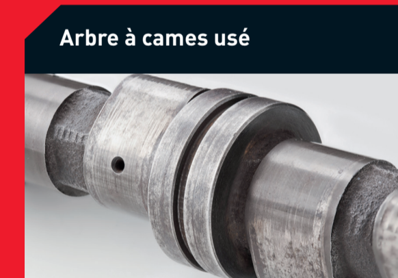
Arbre à cames usé

Causes possibles : • Pose incorrecte • Joint du filtre à huile Solution : • Vérifiez le bon positionnement du filtre à huile ou remplacez-le • Resserrez le filtre à huile ou remplacez-le