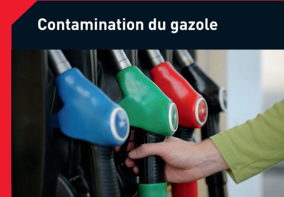
Contamination du gazole

Causes possibles : Pénétration de saleté par une durite cassée, filtre obstrué ou débris résiduels dans le circuit de lubrification Solution : Rincez le moteur pour éliminer tous les débris et remplacez les filtres à huile, à air et à carburant