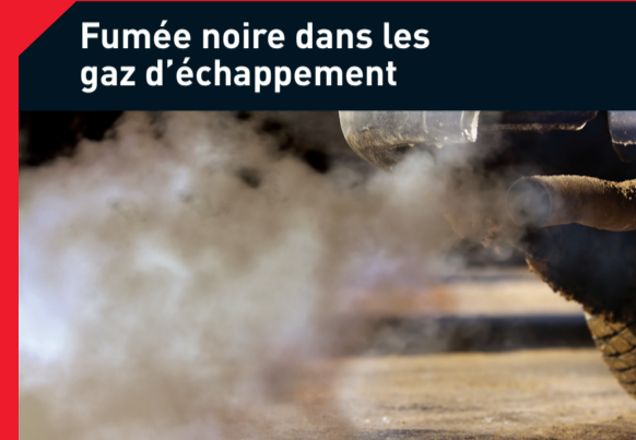
Fumée noire dans les gaz d'échappement

Causes possibles : Filtre à air colmaté Solution : Remplacez le filtre à air