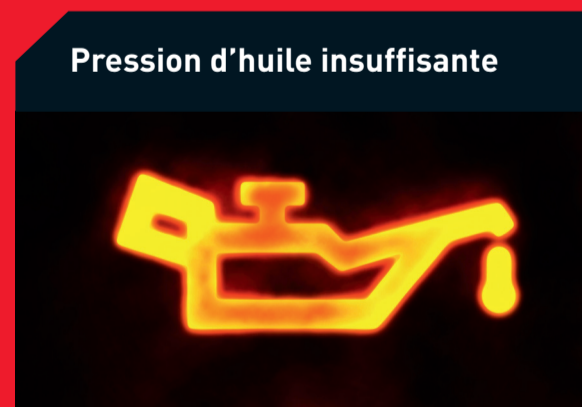
Pression d'huile insuffisante

Causes possibles : Un filtre d'habitacle sale réduit les performances du système de climatisation Solution : Remplacez le filtre d'habitacle