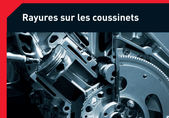
Rayures sur les coussinets

Causes possibles : Filtre à carburant colmaté Solution : Remplacez le filtre à carburant