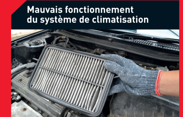
Mauvais fonctionnement du système de climatisation

Causes possibles : Filtre à air colmaté Solution : Remplacez le filtre à air Remplacez le filtre à huile, rincez les canalisations d'huile