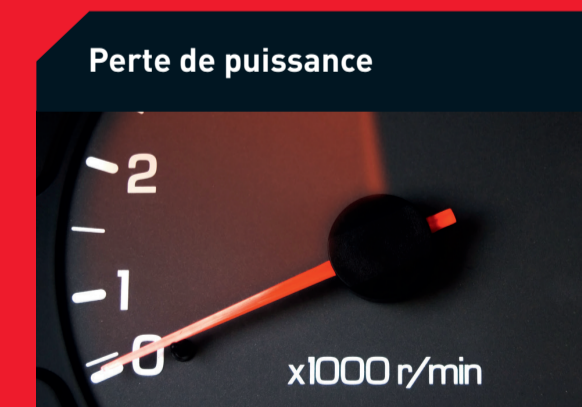
Perte de puissance

Causes possibles : Corps étrangers dans l'admission d'air et dans le circuit de lubrification Solution : Remplacez les filtres à huile et à air, rincez les canalisations d'huile