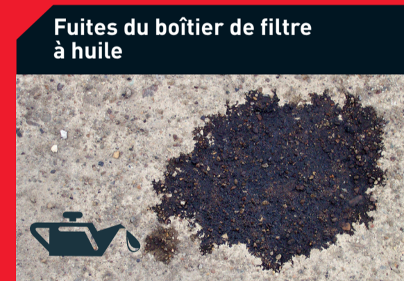
Fuites du boîtier de filtre à huile

Causes possibles : Pose incorrecte Solution : Vérifiez le bon positionnement du filtre à carburant ou remplacez-le