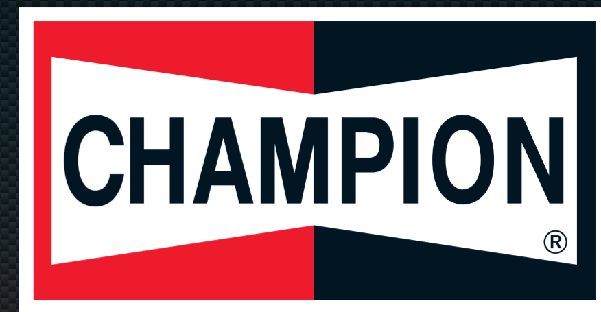
TABLEAU D'ANALYSE DES PANNES DE BOUGIES DE PRÉCHAUFFAGE