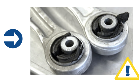
Vroegtijdige slijtage van de draagarmrubbers.

Om te strak aandraaien te voorkomen, beperk je het eerste aantrekkoppel tot een minimale waarde waarbij de draagarmrubbers op hun normale positie komen te zitten. Zodra het voertuig volledig in neutrale positie is, kan het definitieve aantrekkoppel worden uitgevoerd.