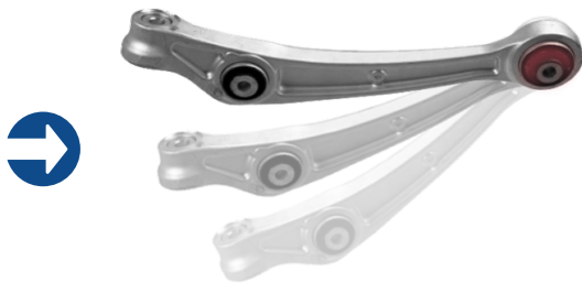
Beweging van de draagarmen bij het naar beneden laten van het voertuig.